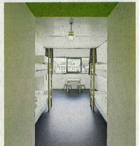
Einblick: ein Vierbettzimmer.