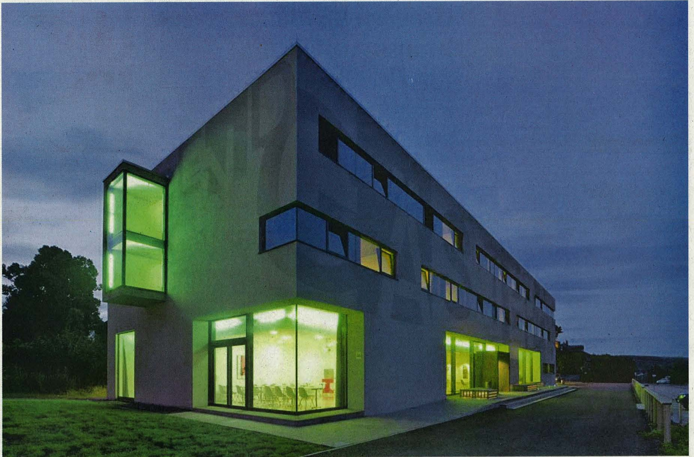
Schmuckstück am Main: das Jugendgästehaus der Stadt bildet den ersten Baustein für die Umgestaltung des Geländes.