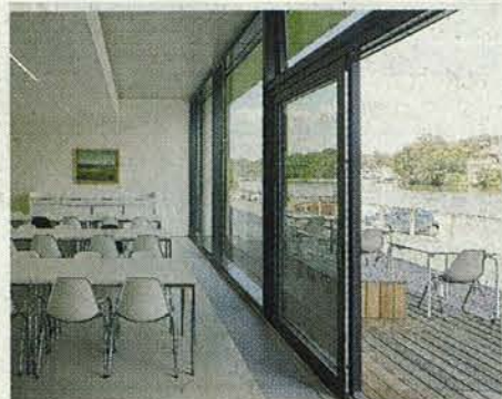
Ausblick: der Speisesaal.