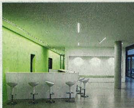
Elegant: das Foyer.