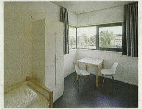
Schön schlicht: ein Zweibettzimmer.

Diese Gebäude können besichtigt werden: Wohnhaus T, Rhönstraße 20: Sa., 26. und So., 27. Juni jeweils 14 Uhr. Jugendgästehaus, Am Unteren Marienbach 3: Sa., 26. Juni, 11 Uhr. Im Rahmen der „kinderAr- chitektouren“ lädt der MuseumsService der Stadt von 11 bis 14 Uhr Kinder zwischen sechs und 14 ans Jugendgästehaus ein.