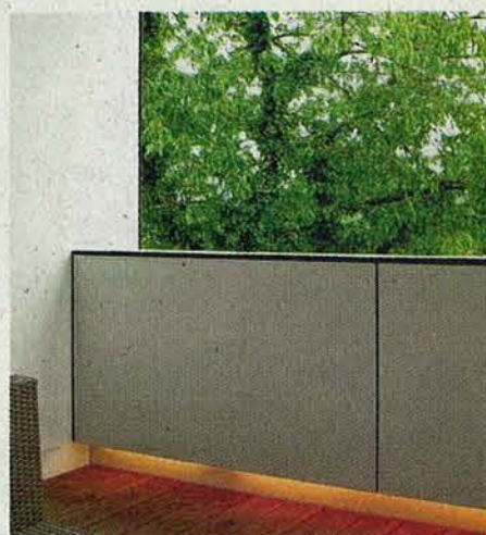
Neu trifft alt: auch auf dem Balkon.