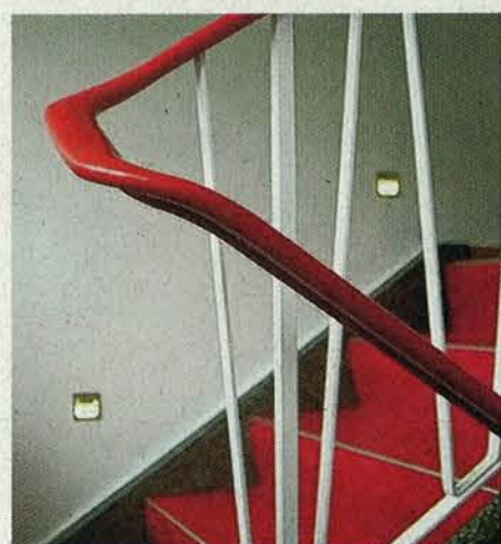
Schönes Detail: die Treppe.